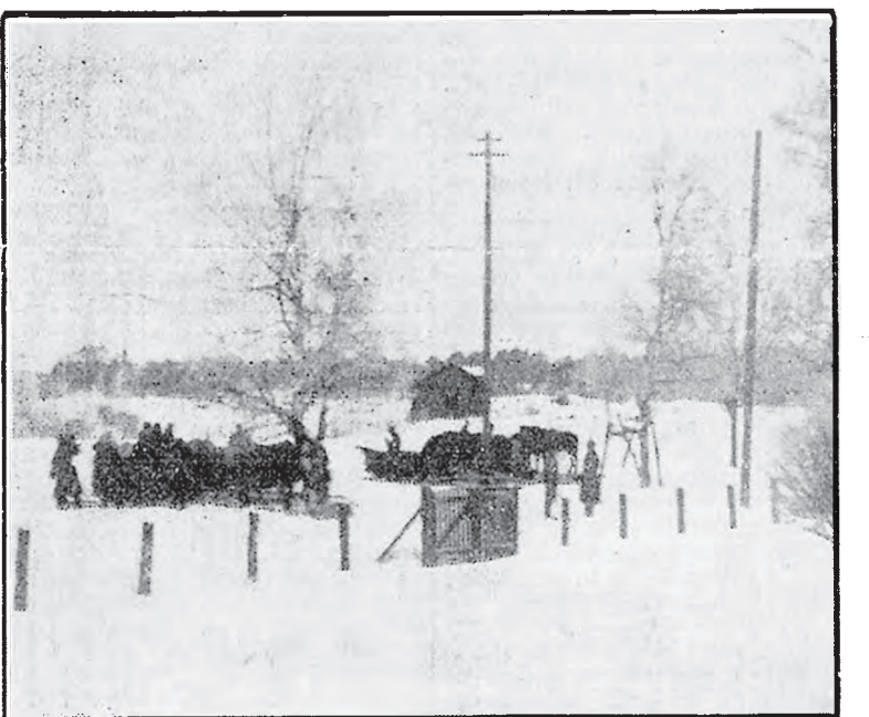
Uudenmaan rykmentin kenttävartiosto Vanhassa kaupungissa. Kuvassemmat keuhkatehtäviä ja kuormastoja.

Pasilan asemalla näkyi oli yhtä vakava kuin Vanhassa kaupungissa. Asemarakennuksen edustalla oli toistakymmentä poliisia sekä joitakin valkoisen kaartin upseereja ja keskilaiturilla käyskelteli sotilaspartii. Kaikki junat tarkastetaan Pasilassa, ilmoitettiin meille. Asemarakennuksen takana oli majoittuneena osasto valkoisen kaartin sotilaita kuormastoi- neen, kiväärikooneen ja niiden vie-