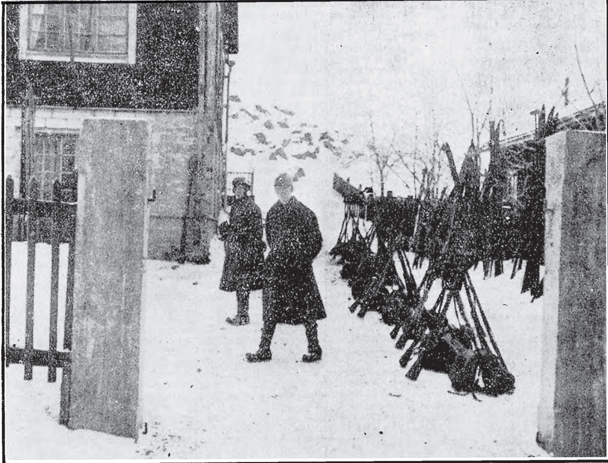
Vanhankaupungin nuorisoseurantaloon majoittuneen joukko-osaston varusteita.